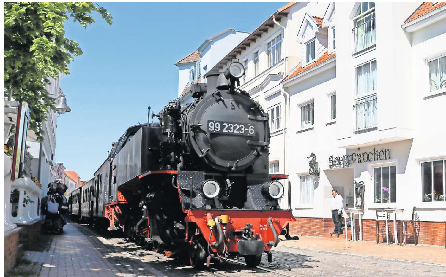
Die Mollistraße in Bad Doberan: Seit einigen Tagen gibt es an der Bummelmeile auch das neue Fischrestaurant „Seepferdchen“ (r.).