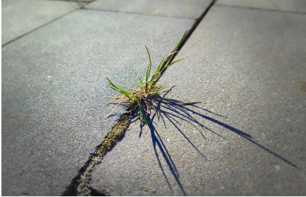
„Kleine Maßnahmen mir viel Wirkung“: Rücknahme von Versiegelungen des Bodens

der Bebauungspläne zur Erreichung der Ziele bei. Dazu gehört auch der Umbau der Energiesysteme (z. B. Solaranlagen, Luft-Wärmepumpen usw.) Darüber hinaus muss die Öffentlichkeitsarbeit drastisch verbessert werden, damit man die Bürger mitnehmen kann. Denn ohne die Bürger ist das Vorhaben wahrscheinlich zum Scheitern verurteilt.