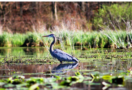
Feuchtgebiete entziehen der Atmosphären Kohlendioxid

Weitere Punkte sind die Entziehung von CO 2 aus der Atmosphäre durch die Förderung von Anpflanzungen (Durchführung auch auf städtischem Boden), sowie die Rücknahme von Versiegelungen des Bodens wo immer möglich und Ersatz durch CO 2 -speichernde Pflanzen (z. B. Laubbäume und Sträucher). Ebenso ist zu prüfen, wo Feuchtgebiete angelegt werden können, die der Atmosphäre Kohlendioxid entziehen. Dies alles sind nur Beispiele, die die Möglichkeiten Kühlungsborns aufzeigen. Sicher gibt es noch mehr davon.